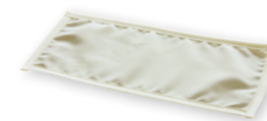
Alpha Prevent® Wirkträger aus Bio-Keramik-Gewebe für die Stabilisierung des natürlichen Erdmagnetfeldes

Nun gibt es mit dem SAMINA Kissen GeoMagnetic© eine weitere einzigartige Möglichkeit, die bewährte Bio-Technologie ganz einfach für einen besseren Schlaf zu nutzen. Durch die im SAMINA Kissen GeoMagnetic© integrierten Alpha Prevent® Wirkträger wird das subtile Geo-Magnetfeld ( \pm 0,5 Gauß) vor allem im Kopf- und Gehirnbereich strukturiert und stabilisiert. Dies scheint deshalb so wirksam zu sein, weil insbesondere die Zirbeldrüse, welche für die Produktion des Nachthormons Melatonin zuständig ist, auf stabilisierte Magnetfelder positiv reagiert.